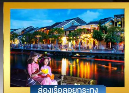
ล่องเรือลอยกระทง