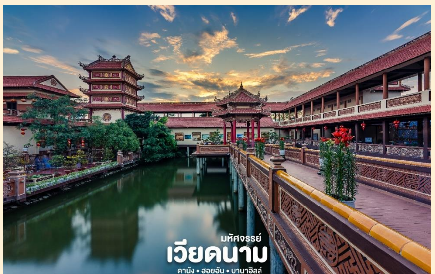
มหัสจรรย์ เวียดนาม ดานัง • ฮอยอัน • บานาฮิลล์

(Nam Son Pagoda) หรือ เจดีย์นัมเซิน ถูกสร้างขึ้น ในปี 1962 เจดีย์นัมเซินมี รูปแบบสถาปัตยกรรมตาม แบบฉบับของเวียดนาม ตอนกลางดั้งเดิม เจดีย์แบ่ง ออกเป็น หลายพื้นที่โดยมี ลักษณะเฉพาะของตัวเอง