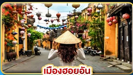
เมืองฮอยอัน