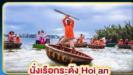
นั่งเรือกระดิง Hoi an