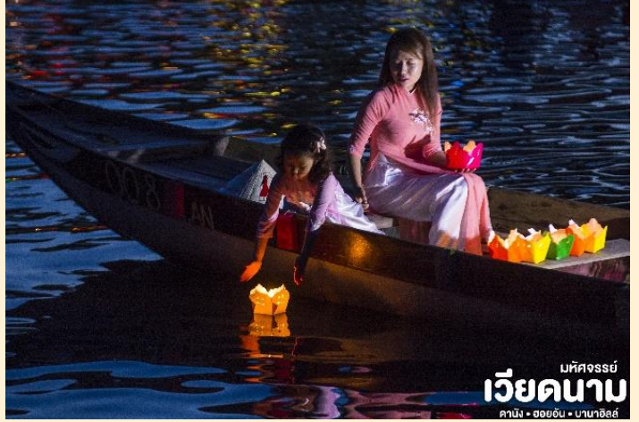
มหัสจรรย์ เวียดนาม ดานัง • ฮอยอัน • บานาฮิลล์

เย็น ๑๒ บริการอาหารเย็น ณ ร้านอาหาร ที่พัก เข้าสู่ที่พัก SEA GARDEN HOTEL 4* หรือเทียบเท่ามาตรฐานเวียดนาม (โรงแรมที่ระบุในรายการทัวร์เป็นเพียงโรงแรมที่นำเสนอเบื้องต้นเท่านั้น ซึ่งอาจมีการเปลี่ยนแปลงแต่โรงแรมที่เข้าพักจะเป็นโรงแรมระดับเทียบเท่ากัน)