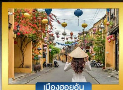
เมืองฮอยอัน