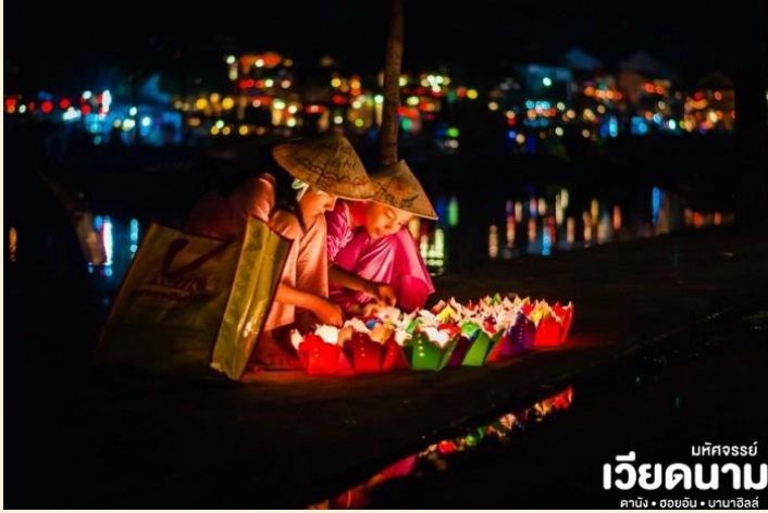
มหัสจรรย์ เวียดนาม ดานัง • ฮอยอัน • บานาฮิลล์