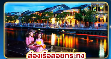
ล่องเรือลอยกระทง